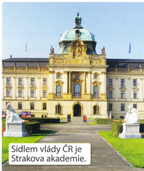
Sídlem vlády ČR je Strakova akademie.

– stát, v jehož čele stojí prezident, není to království.